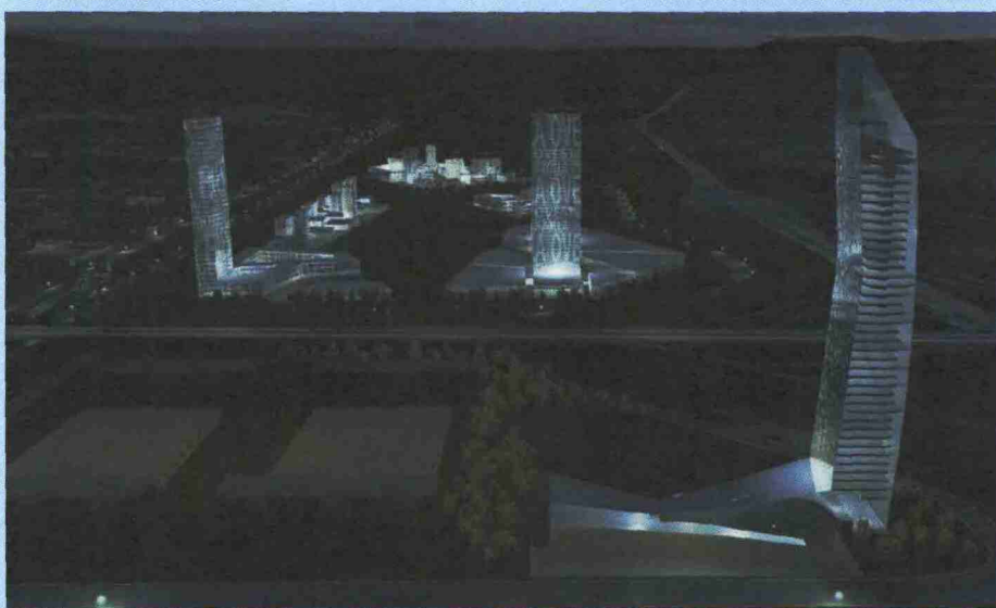
Il progetto di 5+1 AA per Rozzano