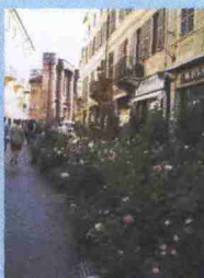
Fiori a Casale