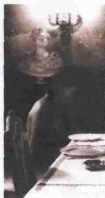
Una foto in mostra